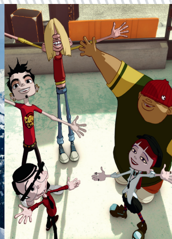
► Garage club, série TV d'animation produite par Pinka.