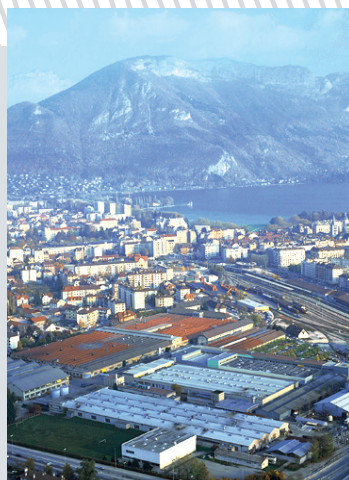
► NTN-SNR, un des fleurons de l'industrie annécienne.