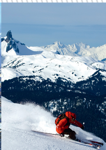
► Salomon, chef de fil des équipementiers de sport.